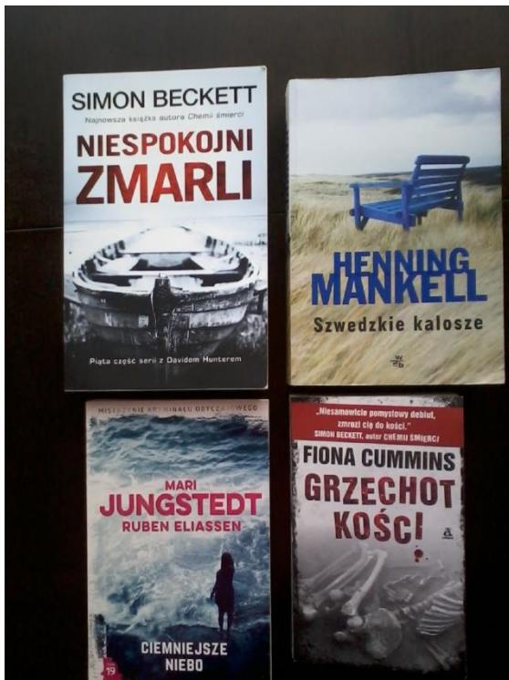
Duży wybór thrillerów/kryminałów współczesnych autorów szwedzkich i brytyjskich