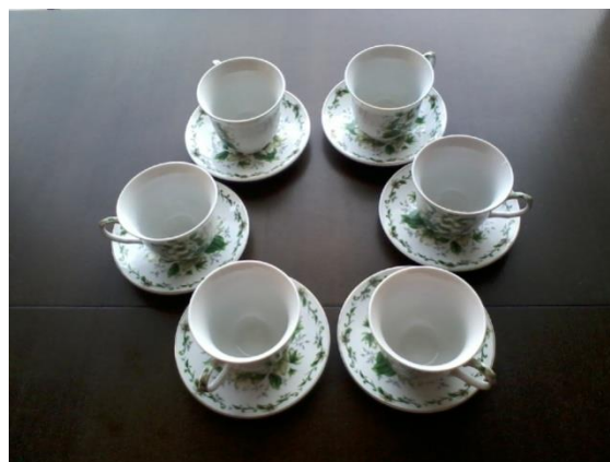
Zestawy filiżanek - od najprostszycy, białych do tych w stylu angielskim - z różami i motywami roślinnymi. Także filiżanki ze spodeczkami – pojedyncze egzemplarze w różnych kształtach i kolorach.