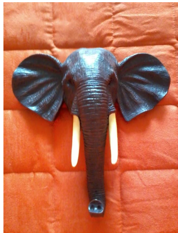
Do nabycia również przedmioty z innych kontynentów: Afryki i Azji