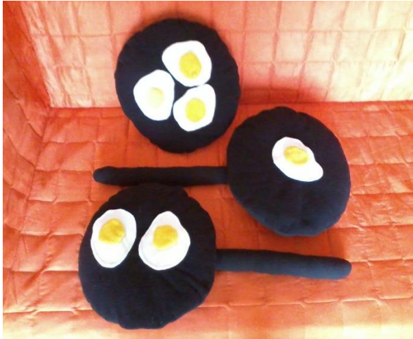
Poduszki „Patelnie z jajkami sadzonymi”.